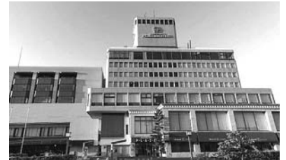
「岡山プラザホテル」

資源を補完し支え合う「地域循環共生圏」を構築することで、地域の持続可能性を高めることができます。さらに、コミュニティや社会全体で知識や技術を共有し、連携して問題