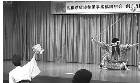
大屋神楽社中による石見神楽“恵比寿”の一コマ