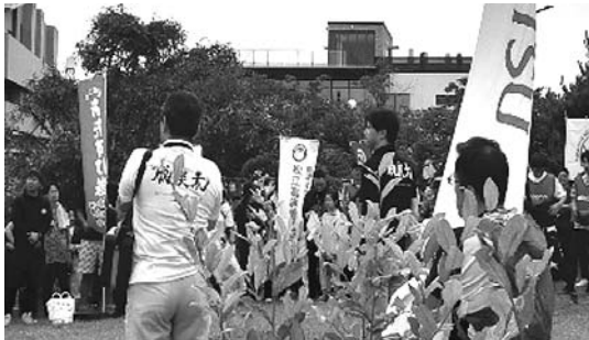
中海・宍道湖一斉清掃開会式（中央—上定松市長）

り多くの人が集合。7時30分からの開会式には、松江市上定市長の挨拶があり、約1時間の間、ごみ拾いや雑草を抜いたりして周辺の清掃活動に従事した。