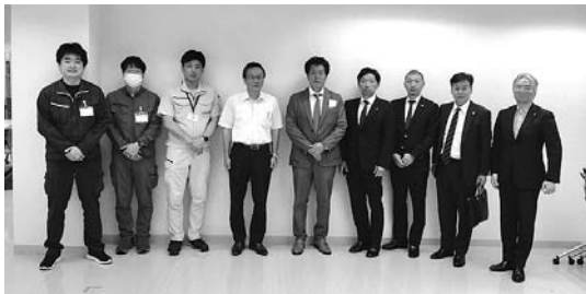
人吉球磨広域行政組合訪問