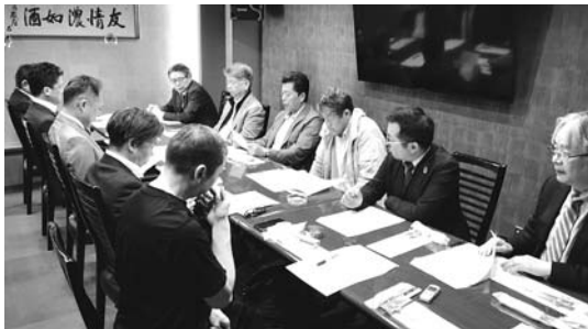
熊本県環境事業団体連合会通常総会