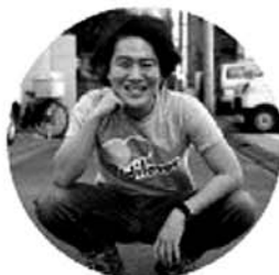
ファシリテーター