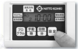
簡単プログラム設定