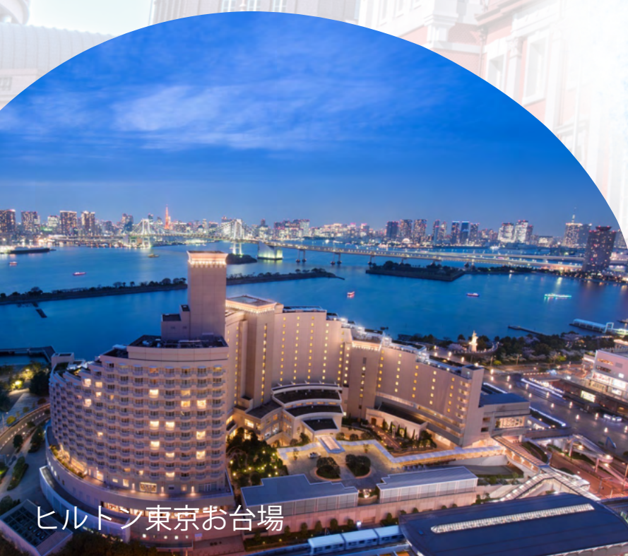
ヒルトン東京お台場

zenkokukankyoren.jp zenkokukankyoren@bz03.plala.or.jp 03-5207-5795