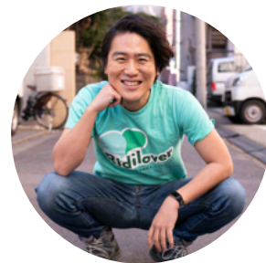
ファシリテーター

テーマ： 「カーボンオフセット循環と浄化槽 インドネシア都市間連携のこれから！」