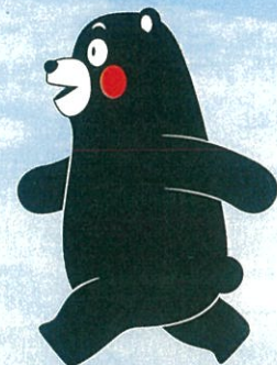
熊本県 PR キャラクターくまモン ©2010 熊本県くまモン #K35457