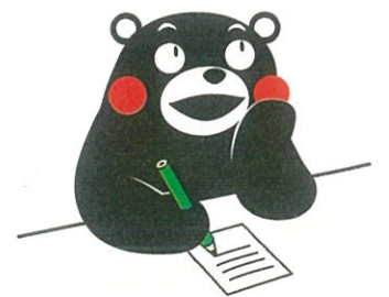
熊本県 PR キャラクターくまモン

2030年までに、汚染の減少、有害な化学物質や物質の投棄削減と最小限の排出、未処理の下水の割合半減、及びリサイクルと安全な再利用を世界全体で大幅に増加させることにより、水質を改善する。(関連する目標のうち、一部を抜粋)